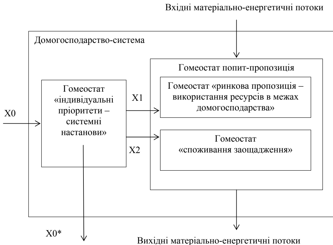
Рис. 1. Основні гомеостатичні підсистеми домогосподарства

джерело інформації X_0^* для інших систем, впливає на інституціональне середовище. Переважаюча дія гомеостатичної підсистеми «системні настанови» обумовлена обмеженими можливостями домогосподарства до адекватного аналізу усього масиву вхідної інформації. Таким чином, для скорочення невизначеності, домогосподарство схильне копіювати дії інших домогосподарств, підкорятися нормам та загальноприйнятним правилам. Формально це забезпечує менш чуттєвий вплив сигналів збурення зовнішньої середовища, а отже менш витрати матеріально-енергетичних ресурсів на підтримку дії гомеостатичних систем. У випадку більш значного впливу «індивідуальних пріоритетів» поведінка домогосподарства може стати навіть девіантною до оточуючої системи.